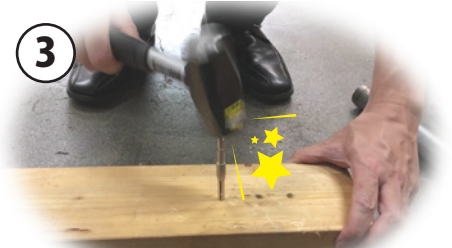
インパクトドライバーを外し、 ホルダー頭部をハンマーで3回ほど叩く。