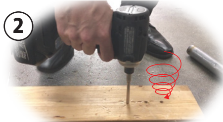
折れたビスの箇所 右回転(正回転)で木材に押し込む。