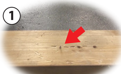
ビスが途中で折れた場合