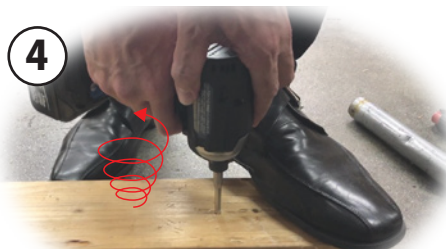
インパクトドライバーに再度取り付け、 左回転(逆回転)で折れたビスを抜く。